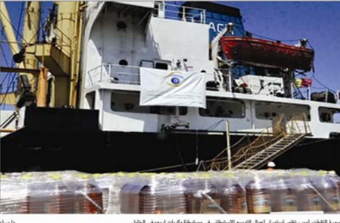
مسير القذافي، استمر لفترة أطول الترحيل الإسرائيلي في سفينة كبريات ايراني، في الخليل.

العريش - وكالات: وصلت سفينة المساعدات الإنسانية التي أرسلتها مؤسسة القذافي لتفويض تفويض مصر الامم المتحدة على طريق غزة مساء امس، الى ميناء العريش المصري بعد ان قامت بطيبر سارها الى مصر ووزارت حوزتها في غزة التي اطلقت عليه اسم 'عمر بن عبد المنذر' الحديوية بين مصر والعريش. وقال مدير مرافق العريش: "لقد تم استقبال السفينة في ميناء العريش المصري بعد ان قامت بطيبر سارها الى مصر ووزارت حوزتها في غزة التي اطلقت عليه اسم 'عمر بن عبد المنذر' الحديوية بين مصر والعريش. وقال مدير مرافق العريش: "لقد تم استقبال السفينة في ميناء العريش المصري بعد ان قامت بطيبر سارها الى مصر ووزارت حوزتها في غزة التي اطلقت عليه اسم 'عمر بن عبد المنذر' الحديوية بين مصر والعريش."