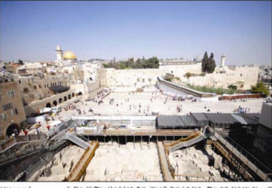
القدس - منظر عام لمخيم البراق والتمديدات التي تقوم بها الإسكان الإسرائيلية بإسماحة لتجديد الأبنية القديمة في القدس.

رام الله - 17 - أكد مجلس الوزراء خلال جلسته الأسبوعية التي عقدها في رام الله أمس برئاسة وزير الخارجية محمد داود، أهمية العمل على إنهاء الاحتلال وتحقيق الديمقراطية في الأغوار.