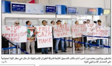
تظاهر وديانهم بطنين، اسم أمم كالتك التسهيل التابعة للحركة الثورات الإسرائيلية، في شارع بيتا الخليلية على الشارع الإسرائيلي لغزة.

القاهرة - وكالات: قال مسؤولون مصريون، ان تصريحات مبارك بخير، هي كلام فارغ. وقالوا: "لقد تم اخلاء 48 دونماً غرب بيت أولا من منطقة الخليل. وقالت قوات الاحتلال: "تم اخلاء 48 دونماً غرب بيت أولا من منطقة الخليل. وقالت قوات الاحتلال: "تم اخلاء 48 دونماً غرب بيت أولا من منطقة الخليل."