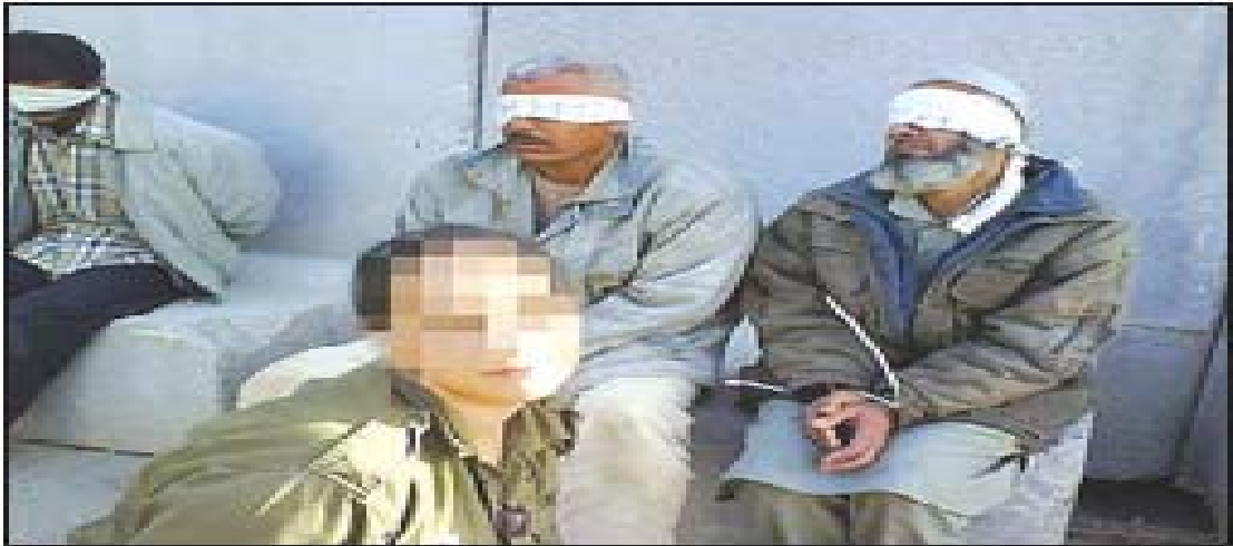
المدى الصور المجندة مع معتقلين مكبلين ومغصوبي الاعين

أما مصدر المعلومات الذي استندت إليه "الحياة الجديدة" في تغطيتها لهذا الحدث فكان موقعي صحيفتي "هآرتس" و"يديعوت أحرونوت" الإسرائيليتين، حيث تورد الصحيفة نصاً من محادثة مكتوبة بين المجندة وصديقات لها يعلقن فيها على الصور لم يرد في "الأيام" يصفن زميلتهن المجندة بأنها "غاية في الإثارة" فترد عليهن "نعم إنني أعلم هههه" و"واو ماما يا له من يوم، أنظري كيف يجعل الصورة كاملة (أي المعتقل) ، أتساءل إن كان لديه فيسبوك ، ولا بد أن أضعه في الصورة هههه ههههه".