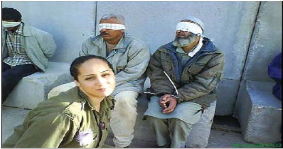
« الصورة التي نشرتها المجندة الاسرائيلية إيدان بيرجيل على موقعها على الفيس بوك مع مواطنين معتقلين مصوبلي الاصلين. »

علما بأن حدثا كهذا كان أولى أن يأخذ مكانه في الصفحة الأولى، سواء في رئيسية الصفحة أو على يمين الصفحة أسفل الرئيسية مباشرة بدلا من التقرير الذي خصصته الصحيفة لجلسة مجلس الوزراء الأسبوعية، وما تمخض عنها من قرارات ليست بأي حال أكثر أهمية من حدث التنكيل الذي تعرض له العمال على نحو ما أظهرته الصور.