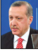
رئيس جمهورية تركيا

غزة - وكالات - أكد رئيس جمهورية تركيا ورئيس الوزراء السيد رجب طيب أردوغان خلال حفل افتتاح قناة (TRT) التركية الناطقة بالعربية، في القدس المحتلة، على ضرورة إنهاء الاحتلال الإسرائيلي للقضية الفلسطينية وفتح آفاق المفاوضات لحل هذه القضية. وقال أردوغان: «القدس هي قلب القدس ونبضها، ويجب حمايتها وحمايتها بأقصى درجات الاهتمام». وأضاف: «القدس هي قلب القدس ونبضها، ويجب حمايتها وحمايتها بأقصى درجات الاهتمام».