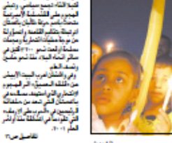
مظاهرة لطلاب غزة يحملون شموع الحرية.