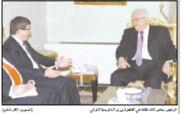
الرئيس سامح الشاذلي في القاهرة... (Caption for the meeting photo)

القاهرة - ولا قال الرئيس... الرئيس يستقبل اعلو... (Text of the meeting with the Egyptian president)