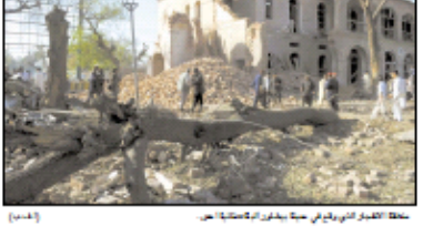
مخلفات الهجوم الانتحاري في مدينة بيشاور الباكستانية.