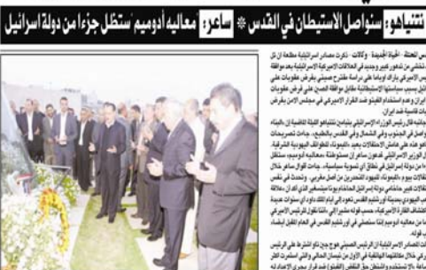
رئيس الوزراء إسماعيل هنية، وزير الخارجية محمد دقنة، ووزير الثقافة خالد الشحادة، ورئيس الوزراء الإسرائيلي بنيامين نتنياهو في رام الله.

غزة - ١٤ - ١٤٠٠ - خرج مئات الأطفال من أبناء الأسرى في مسيرة وشموع الحرية بشموع الحرية، مع شمعة يهودية وشعلة فلسطينية، وذلك في سياق الاحتفال السنوي في غزة بمناسبة الذكرى الأولى لانتفاضة الأقصى، وتحت شعار "شموع الحرية"، شارك في المسيرة ما يقارب ألف طفل من أبناء الأسرى، وهم يحملون شموعاً وشموعاً يهودية وشعلة فلسطينية، وذلك في سياق الاحتفال السنوي في غزة بمناسبة الذكرى الأولى لانتفاضة الأقصى، وتحت شعار "شموع الحرية"، شارك في المسيرة ما يقارب ألف طفل من أبناء الأسرى، وهم يحملون شموعاً وشموعاً يهودية وشعلة فلسطينية. منظمي المسيرة، الذين هم من أبناء الأسرى، قالوا إن المسيرة تهدف إلى تذكير الفلسطينيين بالإنجازات التي حققتها حركة حماس في قطاع غزة منذ تحريرها، والتأكيد على حقهم في العودة إلى ديارهم وأوطانهم، والتأكيد على حقهم في الحرية والكرامة.