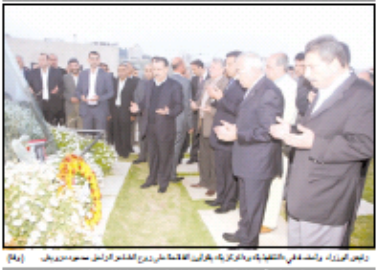
رئيس الوزراء الإسرائيلي بنيامين نتنياهو مع وزير الخارجية إيهود باراك في اجتماع صحفي.

القدس المحتلة - الحياة الجديدة - وكالات: قررت مصادر اسرائيلية مطلقة ان الرئيس نتانياهو وافق على دراسة مقترح صيني بفرض عقوبات على طهران وتل ابيب، وذلك في إطار سلسلة من الاعتداءات المستمرة ضد الفلسطينيين في مناطقهم.