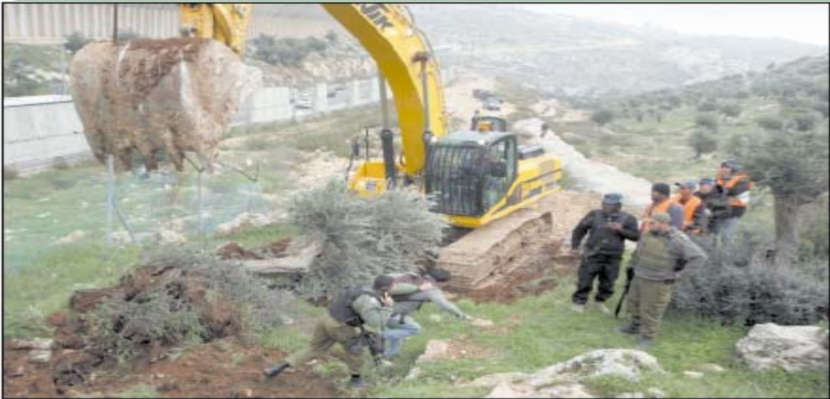
بيت لحم-قوات الاحتلال تقيم مسيرة احتجاجية على تجريف الأراضي الزراعية في منطقة شارع كريمزان القديم في بيت جالا لصالح استكمال جدار الفصل العنصري. أمس. حيث تواصل جرافات الاحتلال أعمال التجريف في الأراضي والتي تقدر مساحتها بأكثر من 300 دونم مزروعة بأشجار الزيتون. (القدس)

" بيت لحم- قوات الاحتلال تقيم مسيرة احتجاجية على تجريف أراض زراعية في منطقة شارع كريمزان القديم في بيت جالا لصالح استكمال جدار الفصل العنصري أمس، حيث تواصل جرافات الاحتلال أعمال التجريف في الأراضي والتي تقدر مساحتها بأكثر من 300 دونم مزروعة بأشجار الزيتون".