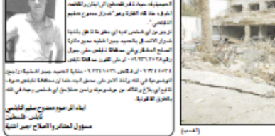
المساعدة في البحث عن مفقود فلسطيني... (Caption for the missing person photo)