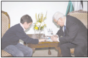
الرئيس الإسرائيلي شيمون بيريز مع وزير الخارجية الإسرائيلي إيهود باراك في اجتماع صحفي.

نتنياهو: اسرائيل الاستيطان في القدس ساعرا: معاوية اوسيم ستحلل جزا من دولة اسرائيل