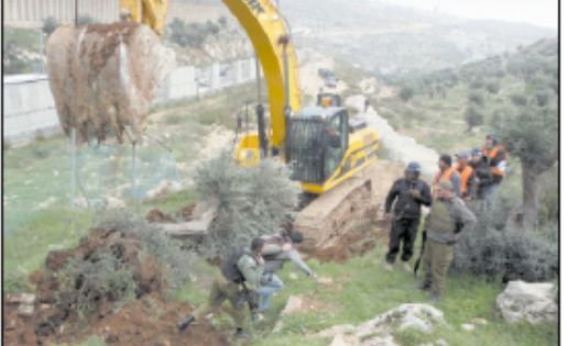
مهندسون يراقبون أعمال البناء في مشروع تطوير مطار كوسيف، في محاولة أخيرة للوصول إلى اتفاق وتسوية لنزاع واشنطن وكوسيف.

مفاوضات غير مباشرة مع واشنطن، في محاولة أخيرة للوصول إلى اتفاق وتسوية لنزاع واشنطن وكوسيف. المفاوضات تجري عبر قنوات غير مباشرة، بهدف التوصل إلى حل سلمي للنزاع.