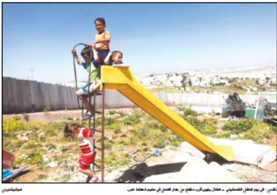
القدس في يوم فصل الصيف - عائل من أطفال يعبون في مدرستهم من مراحق من الفصل في مدينة حنطة عمر.

عمان - مراسلات الشان - حصص - أكد وزير الأوقاف والشؤون والمقدسات الإسلامية في المملكة الأردنية الدكتور عبد السلام العبدوي على أن القدس استثنائية ويجب عدم الاقتراب منه وإن الموضع سيكون كارثيا إذاواصلت إسرائيل ممارساتها الاستثنائية في القدس الشريف والمسجد الأقصى المبارك.