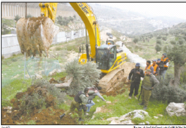
الهيئة العامة للتقسيط في بيروت... (Caption describing the construction site image)